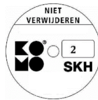
geschikt voor weerstandsklasse 2